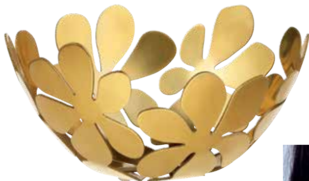
Zdjela Stockholm, 120 kn, Ikea