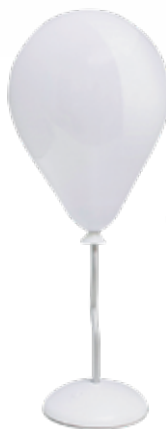
Balvi stolna lampa, 170 kn, Market

Čokolada, šalica ili zdjela, ogledalo, nešto od nakita ili cool komad namještaja? Odaberite, sigurno nećete pogriješiti