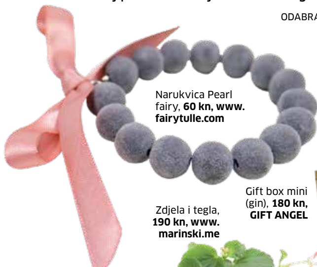
Narukvica Pearl fairy, 60 kn, www.fairytulle.com