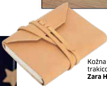
Kožna bilježnica s trakicom, 139 kn, Zara Home