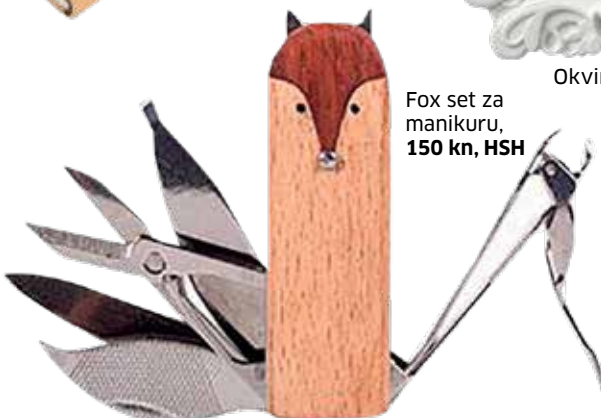
Fox set za manikuru, 150 kn, HSH