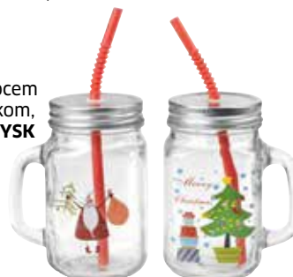
Čaša s poklopcem i slamkom, 7 kn, JYSK