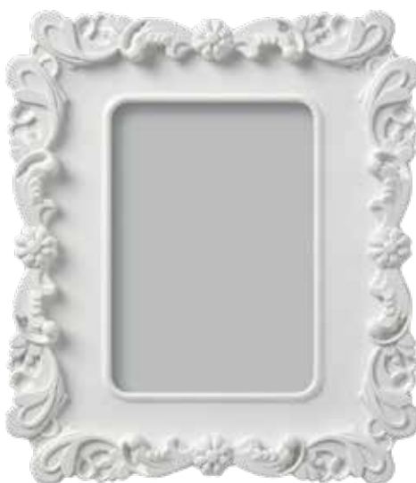
Okvir Kvill, 40 kn, Ikea