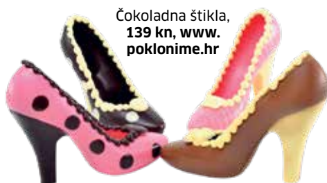
Čokoladna štikla, 139 kn, www.poklonime.hr