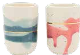
Espresso šalica, set od 2, 230 kn, www.marinski.me