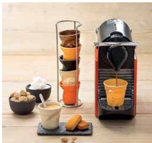
Revol šalice, od 129 kn do 149 kn, Market