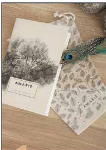
Notebook, 120 kn, www.amarie-fashion.com