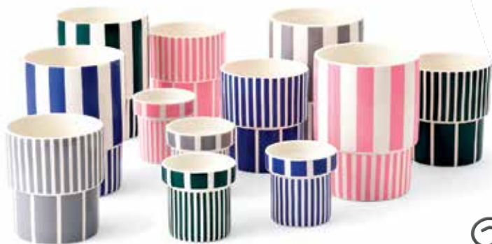
Lolli šalica, od 80 kn, Dizajnholik

Čokolada, šalica ili zdjela, ogledalo, nešto od nakita ili cool komad namještaja? Odaberite, sigurno nećete pogriješiti